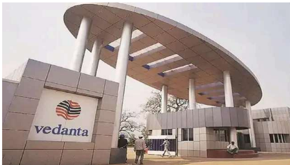
कर्मचारियों के लिए बेहतरीन कार्यस्थल बनी वेदांता। (प्रतीकात्मक फोटो)