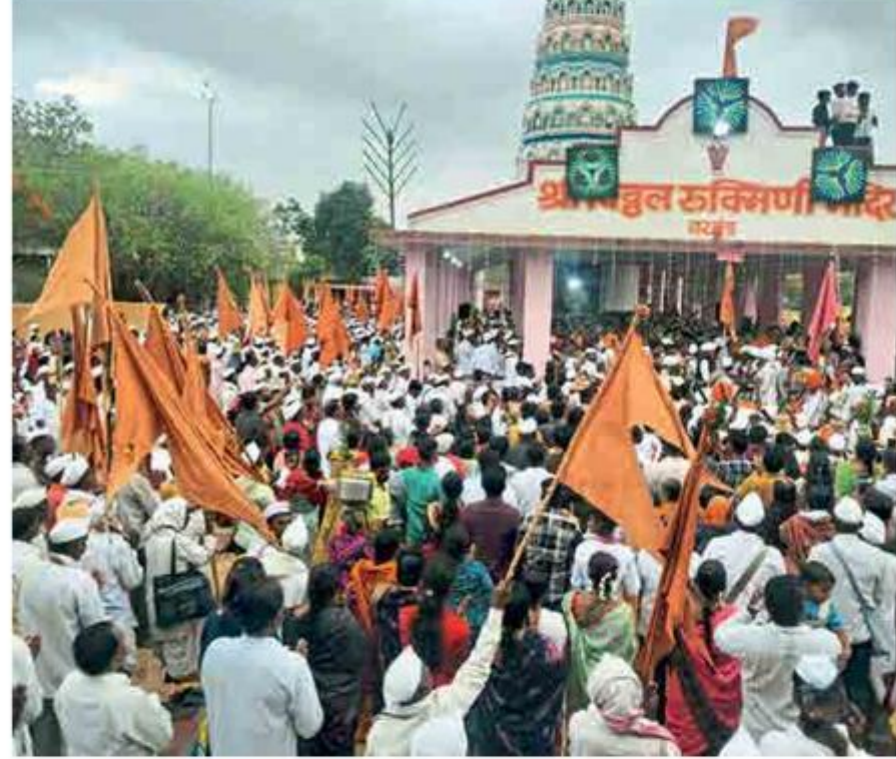
वरवंड : संत तुकाराम महाराजांच्या पालखी सोहळ्यात शुक्रवारी सायंकाळी समाज आरतीसाठी जमलेले वारकरी

आजची वाटचाल यवत ते वरवंड अशी कर्मा अंतराची होती. सकाळी आठ वाजण्याच्या सुमारास सोहळा वरवंडच्या दिशेने मार्गस्थ झाला. पाऊणे दहा वाजता चौघडा, भांडागाव फाटा येथे पोहोचला. महामार्गापासून सुमारे अर्धा किलोमीटर गांव आहे. सोहळा आत गेल्यावर ग्रामस्थ आनंदित झाले होते. रस्त्याच्या कडेने रांगोळ्या काढल्या होत्या. सर्वत्र स्वच्छता होती. पालखी रथातून खांद्यावर घेत श्रीविठ्ठल रत्नमणी मंदिरात सकाळी