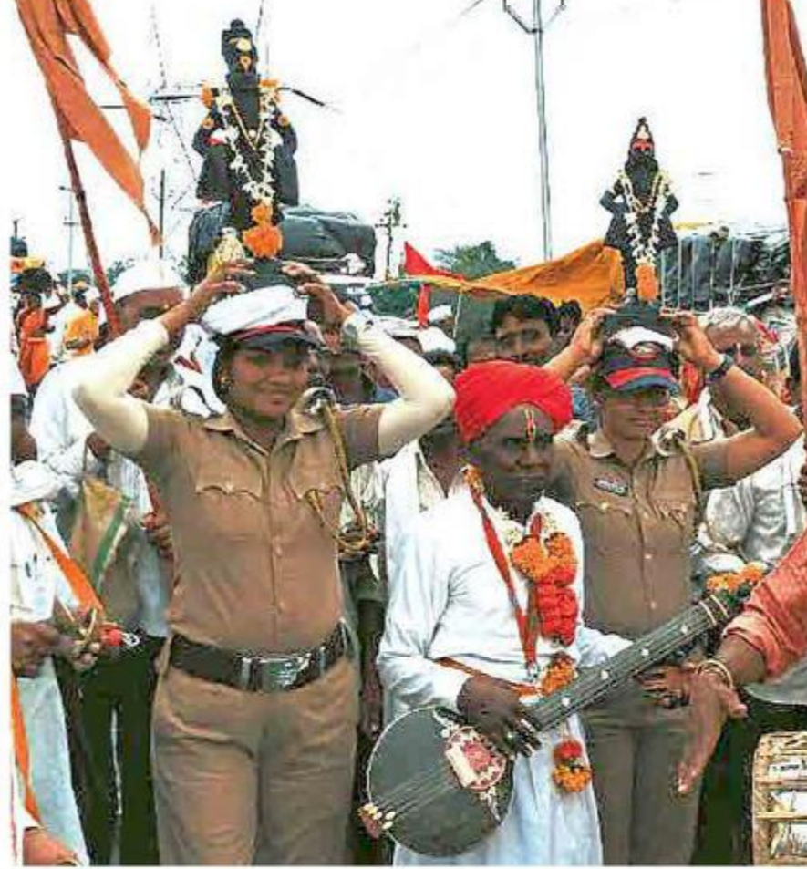
आषाढीवारीत दिवेघाट ओलांडल्यानंतर वारकऱ्यांशी एकरूप होऊन पंढरीची वाट चालणारे महिला पोलिस कर्मचारी.

जेजुरी, ता. १६ : 'माउली' कडेने चाला', 'माउली' पुढे ट्रॅफिक जाण आहे, गाडी आडवी घालू नका', 'माउली' रांगेत उभे राहा, 'डकलाडकली' करू नका', 'माउली' रस्त्यात नका दुकान लावू', हे शब्द कुण्या वारकऱ्यांचे नाहीत. तर, पोलिसांचे आहेत. विनंती करणारे. प्रेमळ. आश्वासक. विश्वास नाही ना बसत! पण, हे वास्तव दिसतच, पंढरीच्या वाटेवर. अन्य वेळी कामाचा भाग म्हणून कडक भाषेत प्रसंगी 'पोलिसी खाक्या' दाखवणारे पोलिस पंढरीच्या वाटेने चालताना आपोआपच विनयशील होतात. 'माउलीम' होऊन जातात. काही पोलिसांना वारीचा जणू लळाच लागतो. गेली अनेक वर्षे पंढरीच्या वारीसाठी असलेल्या बंदोबस्ताच्या ड्युटीची मागणी करत सात्विकतेच्या भक्तिमेळ्यात ते 'माउली' होऊन जातात.